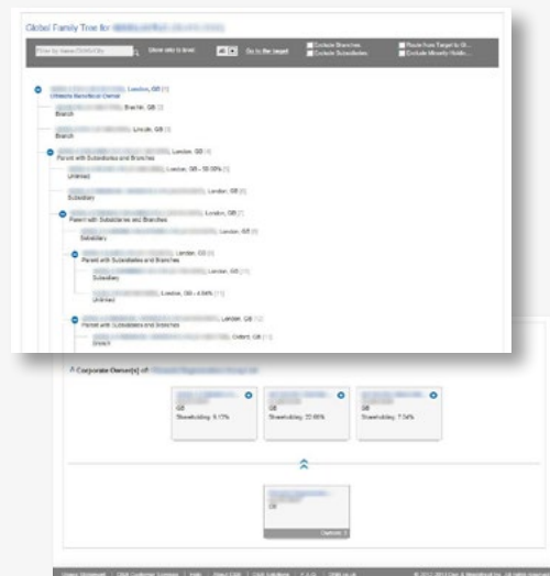
Toets organisaties middels een wereldwijde familiestructuur of een eigendomsstructuur